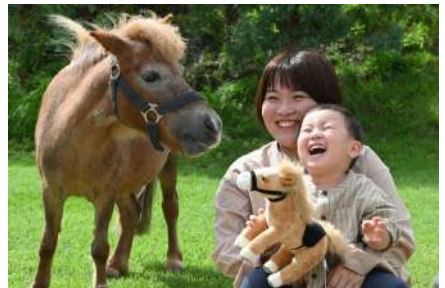
ウマ（ミニチュアホース）との撮影イメージ