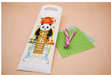
・オリジナルめり絵