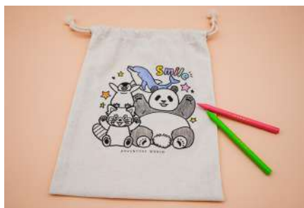
・オリジナルシールブック