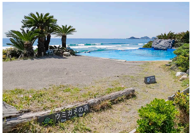
ふ化まで卵を保護する人工ビーチ「ウミガメの浜」