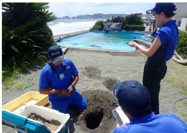
保護卵を埋め戻す様子