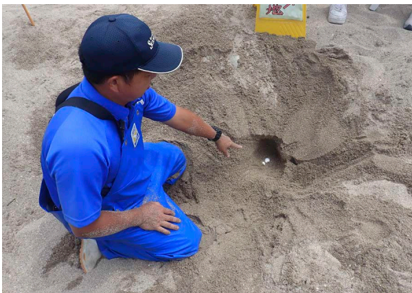
守谷海岸での保護の様子

アカウミガメは、生息環境の悪化（産卵地の減少や海に漂うビニールゴミの誤食など）により生息数は年々減少傾向にあると考えられている。日本はアカウミガメの主要な産卵場所で、千葉県はアカウミガメが毎年産卵にやってくる北限域にあたる。1回の産卵数は80個から140個ほどで、卵はピンポン玉に似ている。およそ2ヶ月後に砂の中でふ化し、ふ化後数日から1週間かけて地表に出て、海に旅立つ。