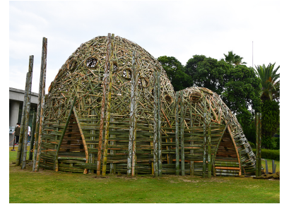
2023年作品「Love of “彩浜”」