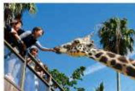
野生を感ずる、自然からの 熱いメッセージに目を傾ける、ひととき