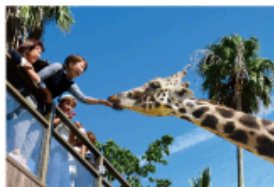
野生を感じる、自然からの 熱いメッセージに耳を傾ける、ひととき