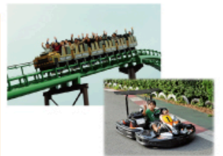
型にこだわらない遊びがまっている