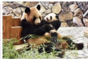
新たな出会いと感動の空間 パンダファミリーに感動の大接近