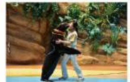
遠い昔から一緒だった 海からのやさしい贈り物に会う