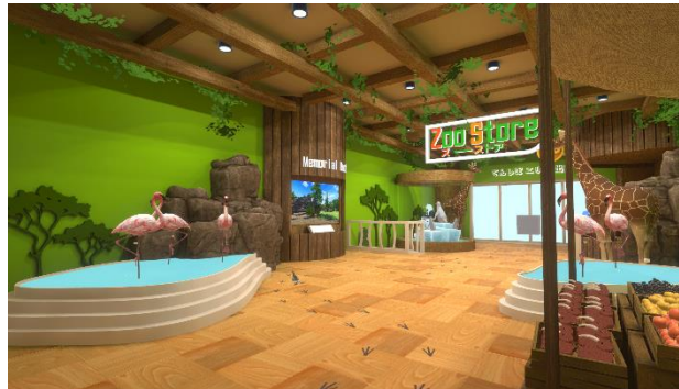
【「TENNOJI Zoo Store」イメージ】

今後も、アクセサリなどの販売を通じて寄附の継続を行い、天王寺動物園の活性化および教育普及の強化に貢献します。