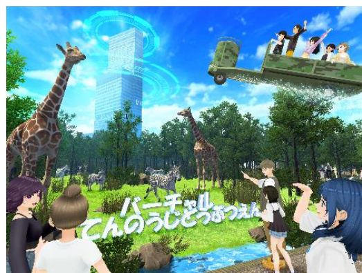
【「バーチャル天王寺動物園」イメージ】