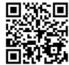
【バーチャルあべのハルカス 公式HP】