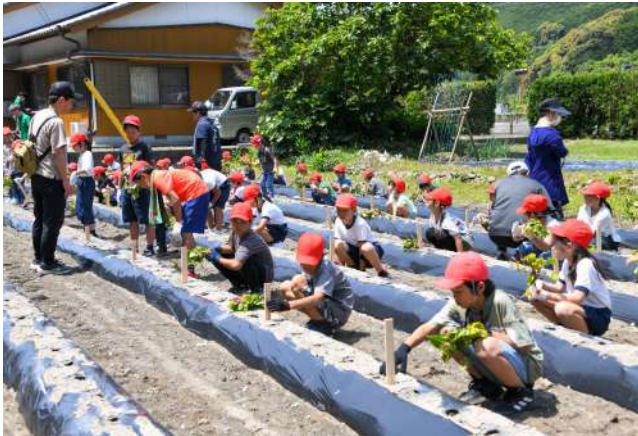
2023年度植え付けの様子