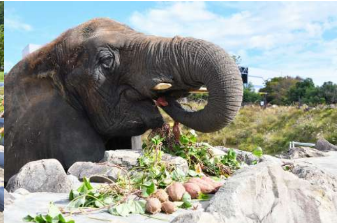
2022年度プレゼントの様子

アドベンチャーワールド（和歌山県白浜町）は、JA紀南すさみ支所と協力し、和歌山県すさみ町立周参見小学校の児童を対象にサツマイモの植え付け体験を実施いたします。植え付けたサツマイモは秋に収穫し、児童からパークの動物たちに与えてもらいます。サツマイモを与えることで動物たちの食事の多様化を図ることができ、バリエーション豊かな食事によって動物たちの満足度を高めます。また、児童がサツマイモを育てる過程で、植物の成長や生き物のつながり、いのちのつながりにふれることで、食べ物の大切さを学ぶ機会を提供します。