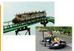
型にこだわらない遊びがまっている