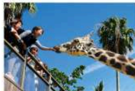
野生を感じる、自然からの 熱いメッセージに目を傾ける、ひととき