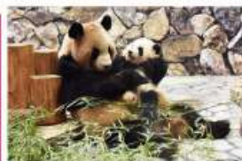
新たな出会いと感動の空間 パンダファミリーに感動の大接近